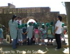
Projecto "Porto do Sol"

Especialista em património industrial e mineiro apontou os "novos patrimónios" (objectos vulgares de uso diário ou vestígios industriais) como testemunha da evolução humana.