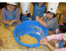
Projecto "Pequenos Mimos"