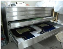
Móvel para tecidos