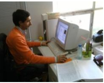
Inventário de espécimes fotográficas