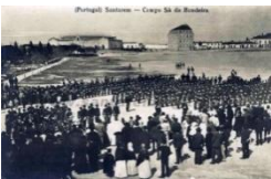
Campo Sã da Bandeira

Horário: Seg. a Sex. das 09h00 às 12h30 e das 14h00 às 17h30