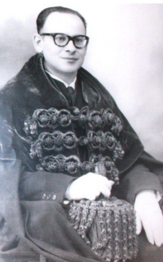
Joaquim Veríssimo Serrão